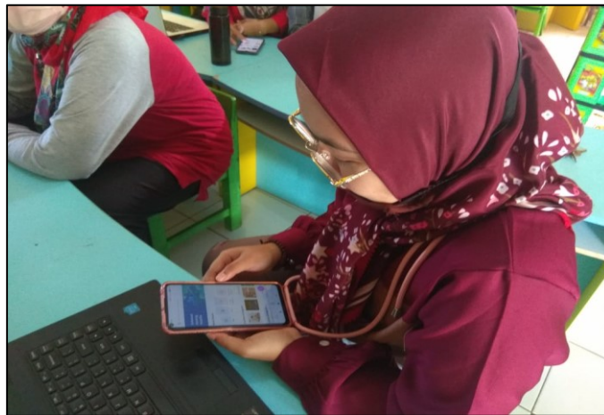
Gambar 2. Proses pengunduhan dan pembuatan akun canva (Dok. Pribadi, 26/03/2021)