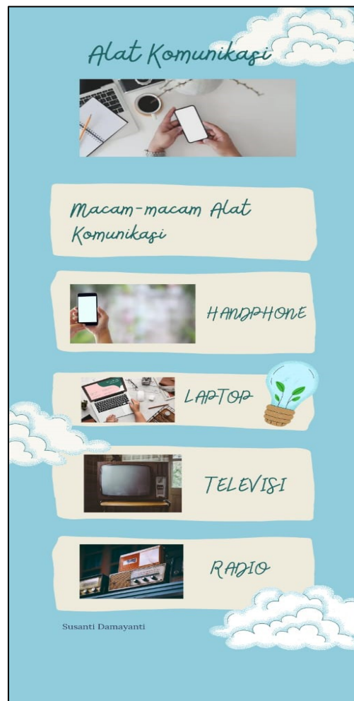
Gambar 4. Hasil desain infografis