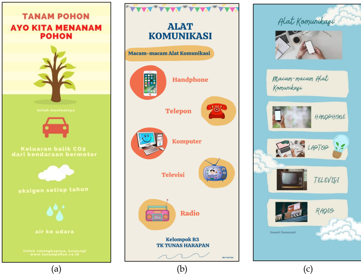
(a) (b) (c) Gambar 5. (a) Hasil desain infografis tentang macam-macam alat komunikasi; (b) hasil desain infografis tentang alat komunikasi; dan (c) hasil desain infografis tentang macam-macam alat komunikasi

anak. Infografis menjadi media yang paling mudah diakses dan efektif sebagai alat komunikasi atau mengkomunikasikan informasi di era digital (Mufti dalam Mansur, 2020). Mengingat infografis dapat menuangkan ide /gagasan seorang guru dalam bentuk gambar serta dengan penjelasan singkat.