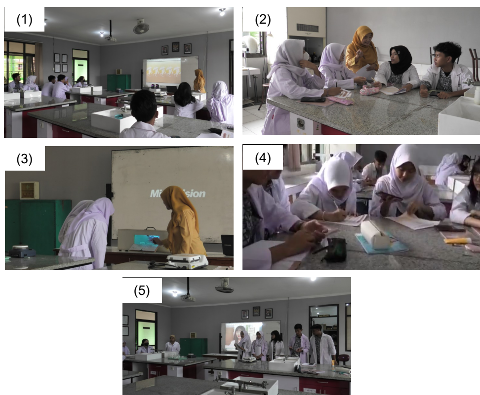
Gambar 2. (1) Stimulation ; (2) Problem Statement ; (3) Pengumpulan Data; (4) Pengolahan Data; (5) Verifikasi dan Generalisasi

Hasil penelitian ini selaras dengan penelitian terdahulu, bahwa pembelajaran Nanoteknologi kimia menggunakan model discovery learning dengan tahapan-tahapan pembelajaran berupa pemberian stimulation , proses problem statement , pengumpulan data, pengolahan data, verifikasi dan generalisasi dapat meningkatkan minat belajar peserta didik pada tiap siklusnya, hal ini ditunjukkan oleh peserta didik yang ikut terlibat aktif dalam pembelajaran serta pemberian bahan ajar yang relevan dengan model pembelajaran yang digunakan (Zain et al., 2023). Hal tersebut juga didukung oleh penelitian terdahulu lainnya, bahwa pembelajaran dengan model discovery learning memiliki pengaruh besar untuk meningkatkan penguasaan konsep peserta didik (Reskawati, 2019). Selain itu, hasil penelitian ini juga sejalan dengan hasil penelitian lainnya yang menyatakan bahwa penguasaan konsep peserta didik dapat ditingkatkan dengan model discovery learning melalui media LKPD (Yusuf, 2016).