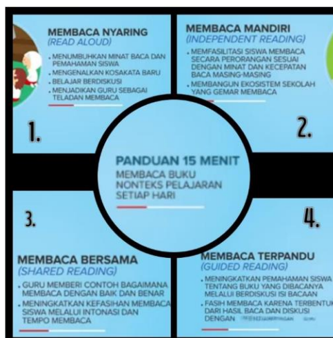
Gambar 1. Panduan 15 Menit Membaca Buku Non teks Pelajaran Setiap Hari di Sekolah

Di tingkat awal pendidikan dasar, aktivitas Membaca Nyaring diajukan karena diyakini mendukung perkembangan literasi dini siswa. Aktivitas ini disosialisasikan oleh Jim Trelease melalui bukunya The Read Aloud Handbook sejak tahun 1982 (buku ini telah diterjemahkan ke dalam berbagai bahasa dan dicetak ulang berkala dengan berbagai pengayaan). Dalam tahap persiapan, pembaca ( reader ) yang dapat merupakan orang tua, guru, atau orang dewasa lainnya perlu memperhatikan tujuan membaca, tahapan kompetensi membaca anak serta jenis bacaan yang sesuai dengan usia dan tahap perkembangannya.