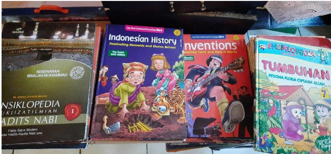
Gambar 2. Kegiatan penyiangan bahan pustaka