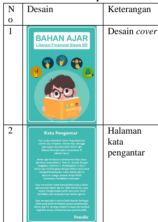
Tabel 2. Tabel Tahapan Produksi

Selanjutnya ada tahapan produk desain bahan ajar Temuan dan pembahasan pada produk desain bahan ajar menghasilkan beberapa bagian dalam bahan ajar digital yang akan di desain. Fase ini mengacu pada desain bahan ajar. Bahan ajar dibuat menggunakan software CorelDraw X7. Pada temuan bagian produksi desain bahan ajar ini, peneliti merinci beberapa tahapan produksi seperti pada tabel 2 di bawah ini.