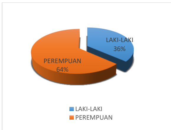
Gambar 1. Histogram Jumlah Partisipan

Data dikumpulkan dalam bentuk wawancara secara langsung kepada tenaga alih daya ( outsourcing ). Wawancara ini dilakukan selama dua hari pada tanggal 24-25 November 2021 di kantor maskapai penerbangan Citilink Indonesia dengan jumlah partisipan sebanyak 11 orang tenaga alih daya yang terdiri dari empat orang laki-laki (36%) dan perempuan sebanyak tujuh orang (64%). Partisipan juga memiliki jenjang pendidikan akhir yang berbeda yaitu 73% berpendidikan Strata1 (S1) dan sebanyak 27% berpendidikan setingkat SMA/SMK. Partisipan juga memiliki jenjang usia dari 20-35 tahun dan masa kerja sebagai tenaga alih daya antara 0-10 tahun.