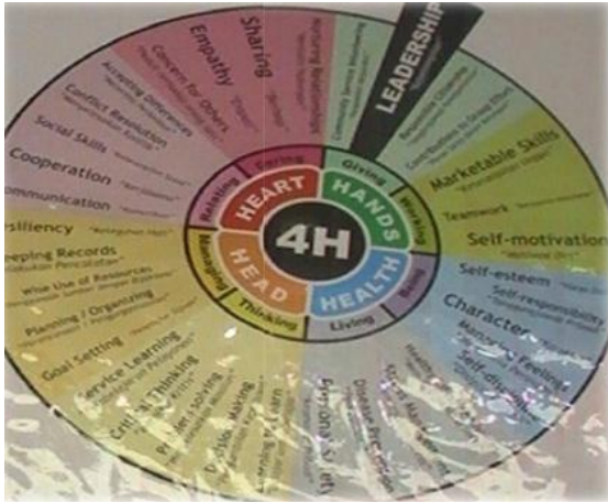
Gambar 2. Sistem 4H

Kekhasan dari SD Cendekia Leadership School adalah pelaksanaan pendidikan karakter menggunakan sistem pengorganisasian siswa. Siswa baru dan siswa lama dibagi dalam 4 kelompok kecil di setiap kelas yakni kelompok hands , head , health dan heart . Setiap kelompok di kelas akan digabungkan dengan kelompok yang sama dikelas yang berbeda, misalnya kelompok hands kelas atau Grade 1 , Grade 2 , Grade 3 , sampai dengan Grade 6 digabungkan menjadi kelompok hands dalam lingkup yang lebih besar, begitupun dengan kelompok head , health dan heart .