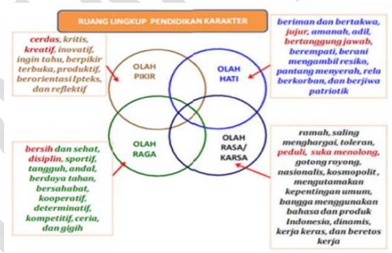
Gambar 1. Bagan Konfigurasi Pendidikan Karakter

Pendidikan karakter meliputi dua aspek yang dimiliki manusia, yaitu aspek ke dalam dan aspek keluar. Aspek ke dalam atau aspek potensi meliputi aspek kognitif (olah pikir), afektif (olah hati), dan psikomotor (olah raga). Masing-masing aspek memiliki ruang yang berisi nilai-nilai pendidikan karakter. Penjelasan ruang lingkup pendidikan karakter terdapat pada bagan di bawah ini: